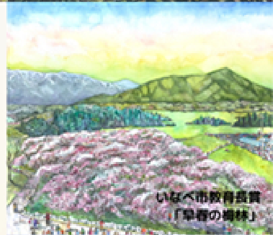
いなべ市教育長賞 「早春の楡林」