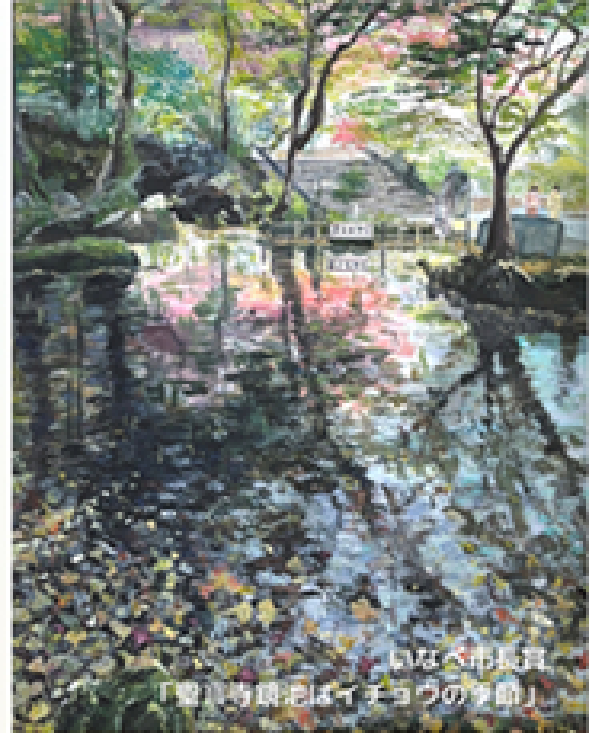
いなべ市長賞 「春の街並みはイチョウの季節」